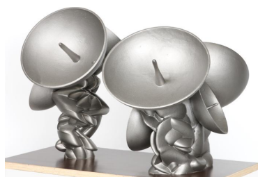
Listeners, Sphäroguss auf Holzsockel, 55 x 58 x 70 cm

Kunsthalle Bern • The Art Institute Chicago • Tate Gallery, Liverpool • Städtische Galerie im Lenbachhaus • Staatliche Kunsthalle, Karlsruhe • Albertina, Wien • Louisiana Museum of Modern Art • Palais des Beaux-Arts, Brüssel • The Brooklyn Museum • Documenta 8 • Houston Contemporary Art Museum • Centre Georges Pompidou • Malmö Konsthall • Musée du Louvre Ermitage, Sankt-Petersburg • Istanbul Modern • Houghton Hall, Norfolk