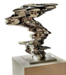
Gates 70, Edelstahl, poliert, 66 x 62 x 55 cm